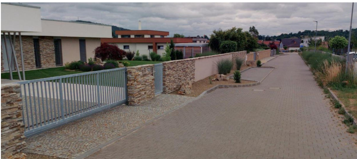
Obrázek 2 - přijatelná výška oplocení v kombinaci s průhlednou výplní na celou výšku