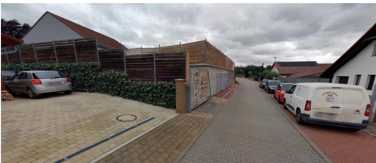
Obrázek 3 - nepřiměřená výška oplocení

V případě některých ulic vzniká i kombinace historického a novodobějšího utváření veřejného prostranství, oplocení. Např. v ulici Vinohradská je dobový předěl mezi původní zástavbou a novodobou proveden v kontrastu s delším předpolím objektů s neoplocenými předzahrádkami. Vzniká tak zajímavý a citlivý přechod mezi starou výstavbou a novodobými potřebami současné výstavby.