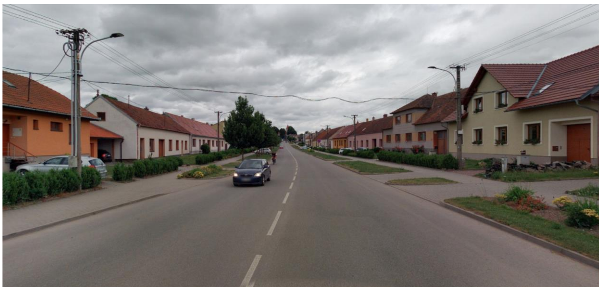
Obrázek 1 - centrální Drásov s vymezením veřejného prostranství pomocí fasád objektů

Vnitřní historická uspořádaná zástavba s označením 1-1 je charakteristická spoluutvářením veřejného prostranství přímo stavbami. Veřejný prostor je tedy definován přímo stavbami rodinných domů, historických stavení. Vlastní stavba objektu hlavního tedy svou fasádou vymezuje veřejný prostor. Vzniká tak zcela tradiční charakter vymezení veřejného prostoru, který odpovídá i původnímu „Drásovskému„ veřejnému prostoru.