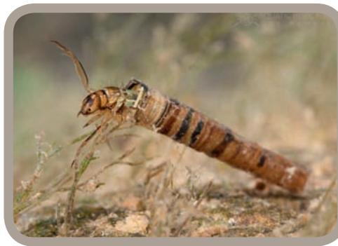
Larva chrostíka ve schránce

vod zejména díky své potravní biologii. Je pro ně typická skeletizace listů napadaných do vody (vyžrané kostřičky listů), jsou tzv. drtiči (shredders). Listí spadlé na hladinu je kolonizováno houbami, bakteriemi a po nárůstu tohoto mikro-