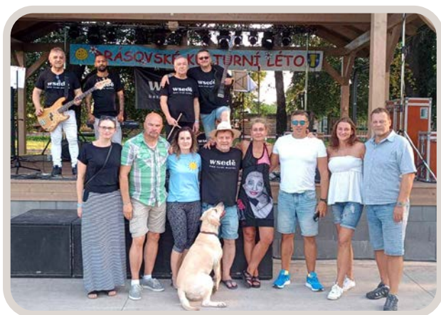
Na snímku s Petrem Čtvrtníčkem hudební skupina Wsedě, ředitel kuřimské věznice a vychovatelé

Letošní Drásovské kulturní léto navštívila známá osobnost a to český filmový a divadelní herec, komik a spoluvůrce scénářů Petr Čtvrtníček. Měli jsme možnost ho v Drásově vidět jako hosta vězeňské kapely Wsedě, kde hrál na bicí. Na návštěvě našeho festivalu ho provázela jeho nerozlučný kamarád labrador Berta, se kterým vystupuje i v nejrůznějších pořadech (např. Show Jana Krause). Petr Čtvrtníček se mimo svou uměleckou a zábavnou tvorbu věnuje také malovýrobě uzenin a pyšní se i svou osobní značkou uzeniny „četnická klobása.“ Na příští ročník našeho hudebního festivalu přislíbil svoji účast jako poskytovatel občerstvení s nabídkou svých produktů. Věříme, že termín příštího Drásovského kulturního léta nebude kolidovat s jeho nabitým profesním programem a že se opět za rok uvidíme.